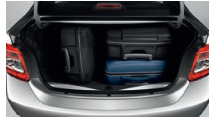
Capacidad del maletero de 510L