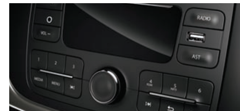
Dacia Plug&Radio (radio CD MP3, Bluetooth® y toma Jack y USB).