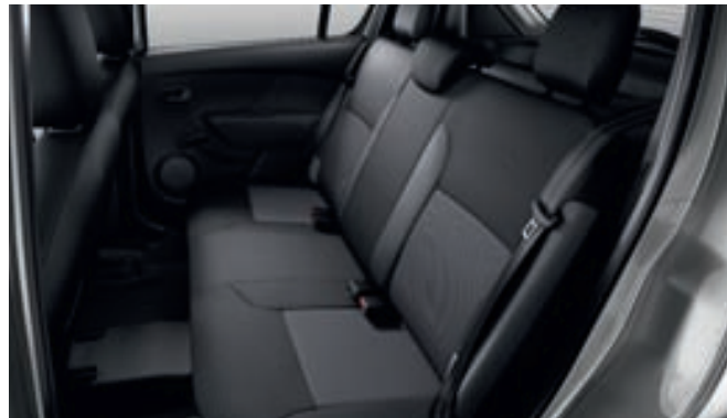
Banqueta trasera con reposacabezas