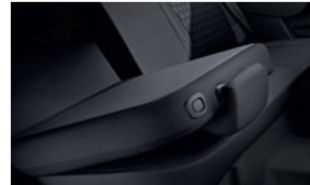
Banqueta trasera abatible 1/3 - 2/3