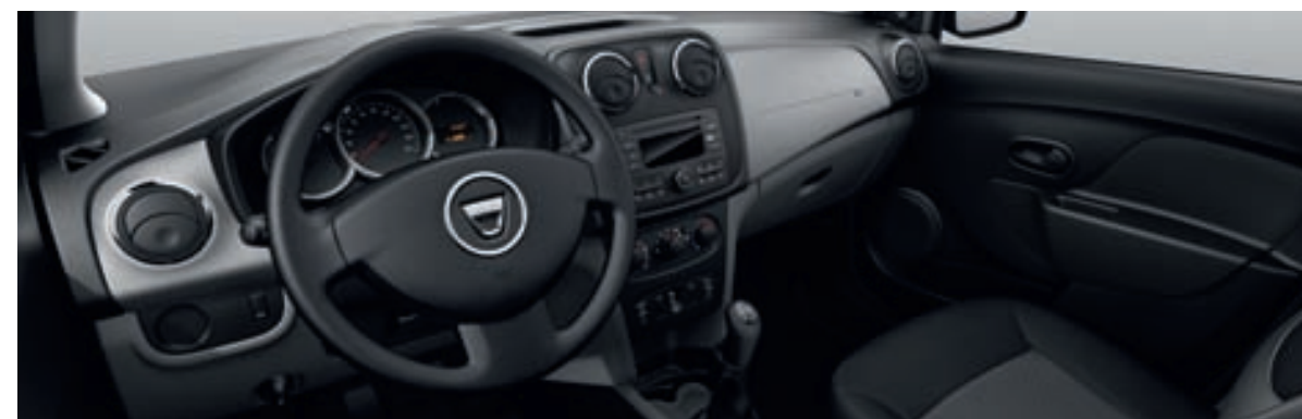
Aire acondicionado y Dacia Plug&Radio de serie.